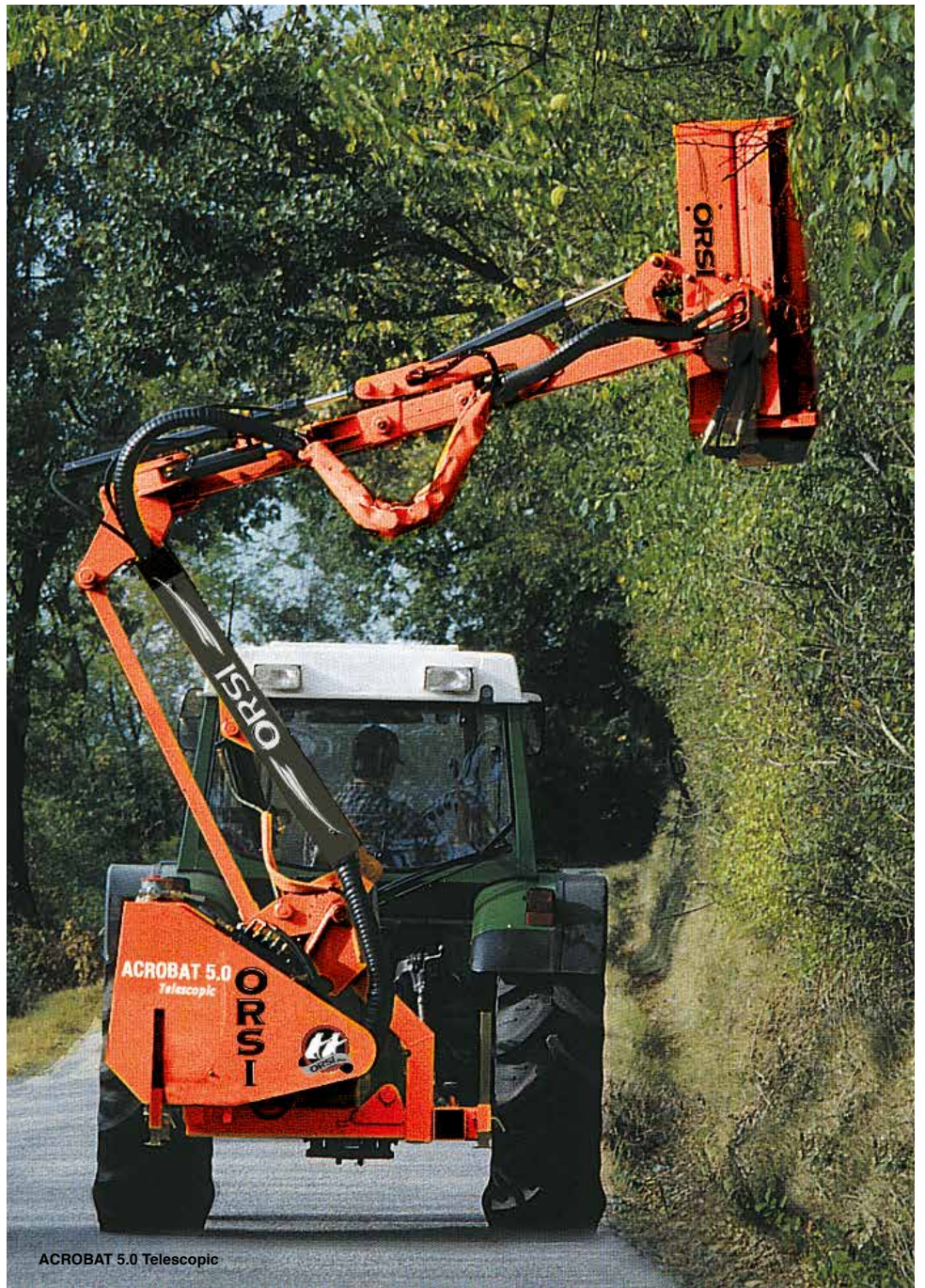
ACROBAT 5.0 Telescopic