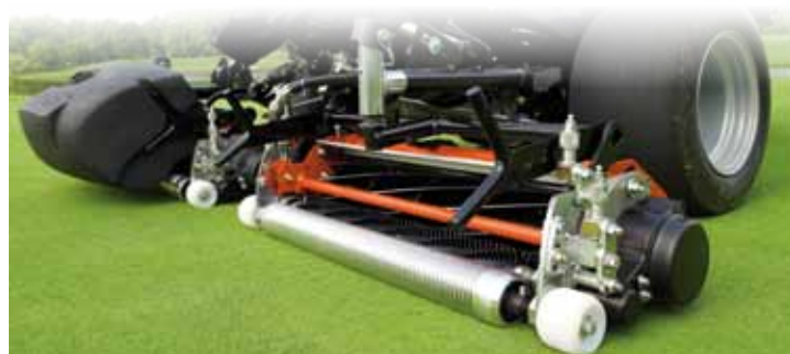
Jacobsen Classic XP Cutting Systém zajišťuje precizní stříh a dokonalou homogenitu greenů