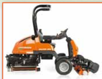
Výsuvné centrální vřeteno – snadná údržba a servis

ITTEC s.r.o. AOS Modletice 106 251 01 Říčany u Prahy Tel.: (+420) 323 616 222, Fax: (+420) 313 616 223 E-mail: info@ittec.cz