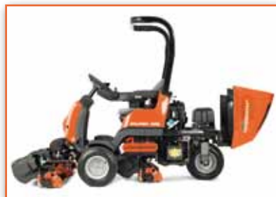
Snadný a pohodlný přístup k motoru