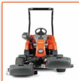
Individuální ovládní vřeten – maximální využití s minimálním utužením půdy při začíšťování a sečení kolarů