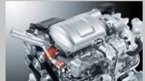
FARMotion motory se systémem Common Rail s max. tlakem až 2000 barů, zcela bez DPF a SCR.

Jednoduché všestranné: hydraulické čerpadlo 50 l/min až pro tři zadní mechanicky ovládané okruhy, zadní třibodový závěs s kapacitou 3500 kg a PTO až se třemi rychlostmi. Jednoduchá komfortní kabina: 360° výhled, široké dveře a vysoce ergonomické ovládání. Nová řada modelů 5D Keyline je ta pravá volba pro kohokoli, kdo chce pracovat zkrátka ekonomicky.