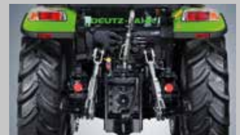
Hydraulické čerpadlo 50l/min. pouze pro pracovní hydrauliku, až 3 hydraulické okruhy, zvedací síla zadního TBZ až 3500 kg a až 3 rychlosti PTO (540/540E/1000).