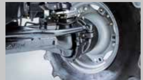
Elektronicky ovládaný pohon všech kol a 100% uzávěrky diferenciálů, brzdění všemi koly a 55° úhel natočení kol.