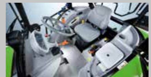
Komfortní kabina. 360° výhled, vysoce ergonomické ovládání a výběr ze dvou možností střechy.