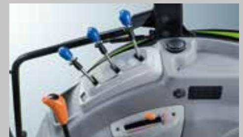
Mechanická převodovka až s 30 + 15 převody, 40 km/h při snížených otáčkách motoru.