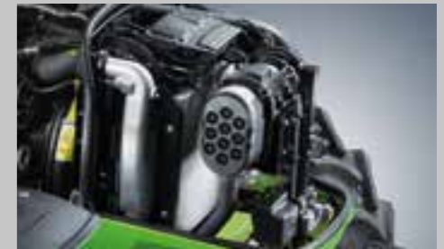
Kompaktní chladič s Visco ventilátorem a PowerCore vzduchovým filtrem pro maximální účinnost motoru.