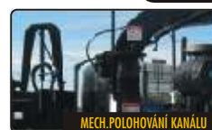
MECH. POLOHOVÁNÍ KANÁLU