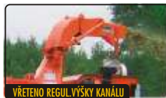
VŘETENO REGUL. VÝŠKY KANÁLU