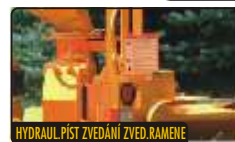
HYDRAUL. PÍST ZVEDÁNÍ ZVED. RAMENE