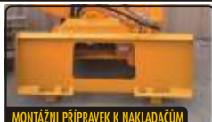
MONTÁŽNÍ PŘÍPRAVEK K NAKLADAČŮM