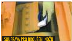
SOUPRAVA PRO BROUŠENÍ NOŽŮ