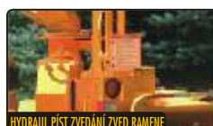
HYDRAUL. PÍST ZVEDÁNÍ ZVED. RAMENE