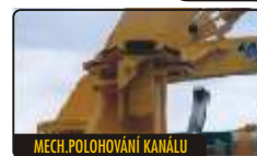
MECH. POLOHOVÁNÍ KANÁLU