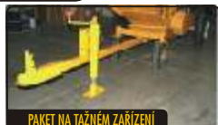
PAKET NA TAŽNÉM ZAŘÍZENÍ