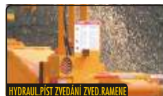
HYDRAUL.PÍST ZVEDÁNÍ ZVED.RAMENE