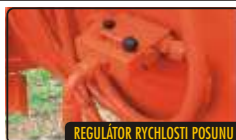
REGULÁTOR RYCHLOSTI POSUNU