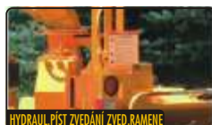
HYDRAUL. PÍST ZVEDÁNÍ ZVED. RAMENE