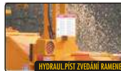
HYDRAUL.PÍST ZVEDÁNÍ RAMENE