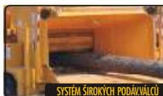
SYSTÉM ŠÍROKÝCH PODÁVÁČŮ