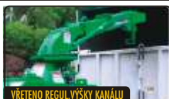
VŘETENO REGUL.VÝŠKY KANÁLU