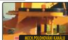
MECH. POLOHOVÁNÍ KANÁLU