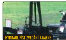
HYDRAUL. PÍST ZVEDÁNÍ RAMENE