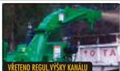
VŘETENO REGUL.VÝŠKY KANÁLU