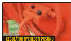
REGULÁTOR RYCHLOSTI POSUNU