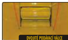
DVOJITÉ PODÁVACÍ VÁLCE