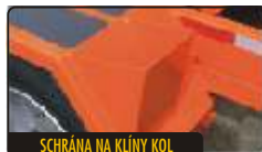
SCHRÁNA NA KLÍNY KOL