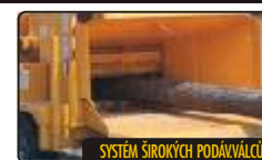
SYSTÉM ŠIROKÝCH PODÁVAČŮ