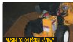
VLASTNÍ POHON PŘEDNÍ NÁPRAVY