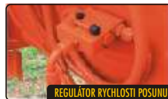
REGULÁTOR RYCHLOSTI POSUNU