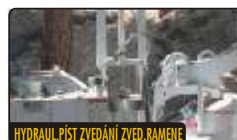
HYDRAUL.PÍST ZVEDÁNÍ ZVED.RAMENE