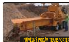
PŘÍVĚSNÝ PODÁV. TRANSPORTÉR